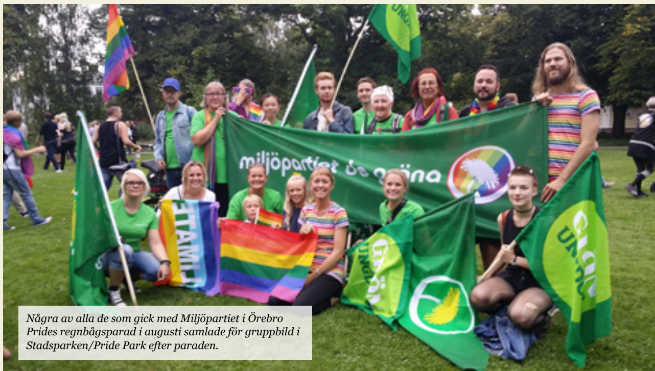
Några av alla de som gick med Miljöpartiet i Örebro Prides regnbågsparad i augusti samlade för gruppbild i Stadsparken/Pride Park efter paraden.